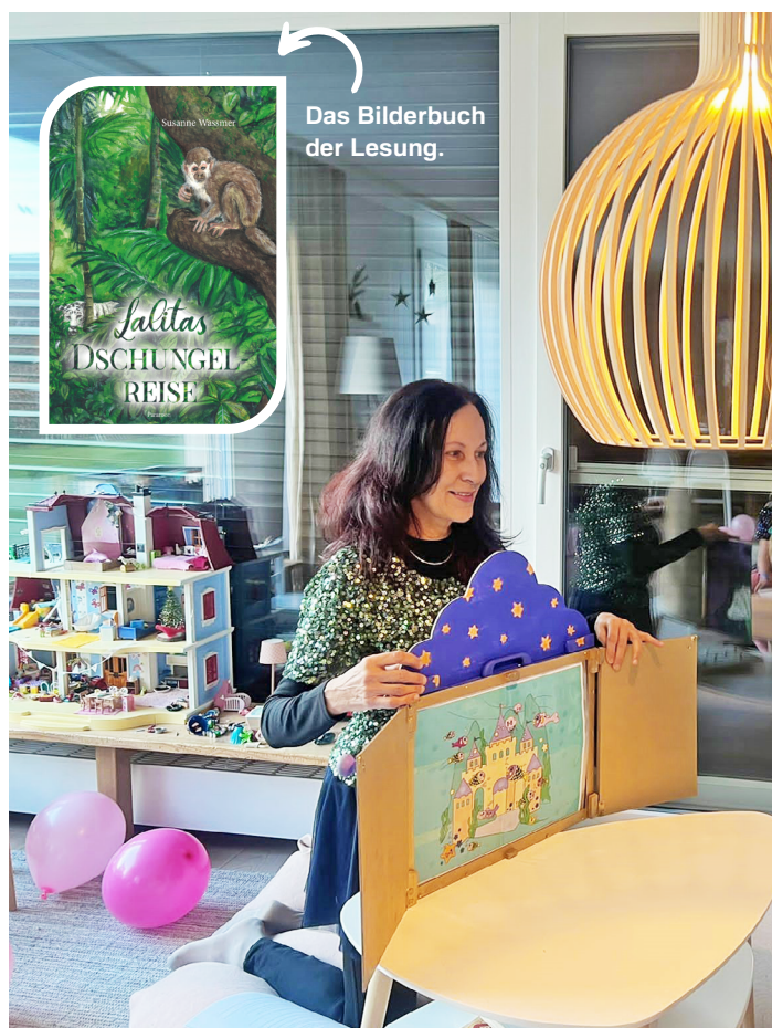
Das Bilderbuch der Lesung.

➔ Die Lesungen für Kinder beginnen 9.30 Uhr und 10.30 Uhr und dauern jeweils 20 Minuten.